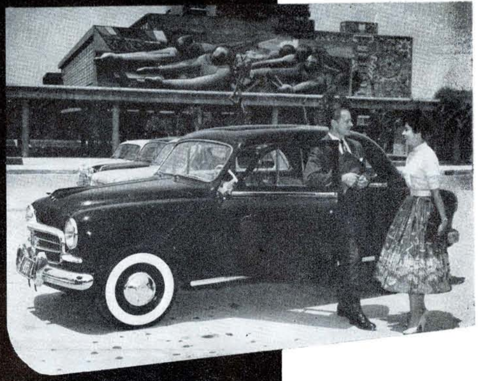
el FIAT "1400 A"

Cuatro a seis plazas 125 kilómetros por hora, 10 litros de combustible por 100 kms.