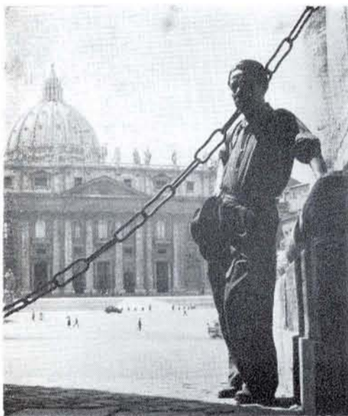
EL PINTOR en la Plaza de San Pedro.

Tata Jesucristo del maestro Francisco Goitia; o los murales realizados en exterior (cuatro mil metros cuadrados) de las cuatro caras del edificio de la Biblioteca de la Ciudad Universitaria en el Pedregal de San Angel. Y así podríamos seguir citando infinidad de ejemplos; y la razón es clara y lógica: realmente hace pocos años, con motivo de la Revolución Mexicana, empezó a nacer una conciencia plena y clara de nuestra mexicanidad, de nuestra historia; somos un pueblo joven, y como se dice en Europa, tropical, es decir, exuberante y pleno de vida. Somos un México que ve y trabaja hacia el futuro. El arte de la pintura es una de las expresiones que más ha trabajado por dar a conocer todos los valores con los que cuenta México para su total revalorización y progreso.