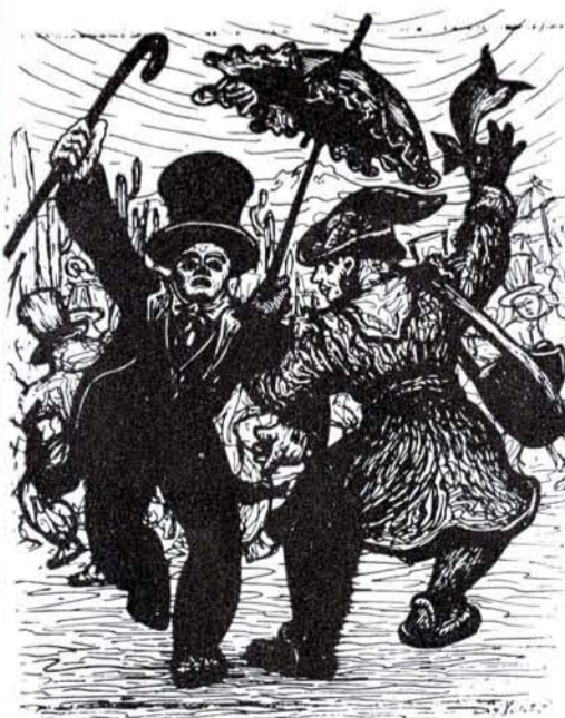
¿BAILAMOS, MI Rorro?; la misma técnica.