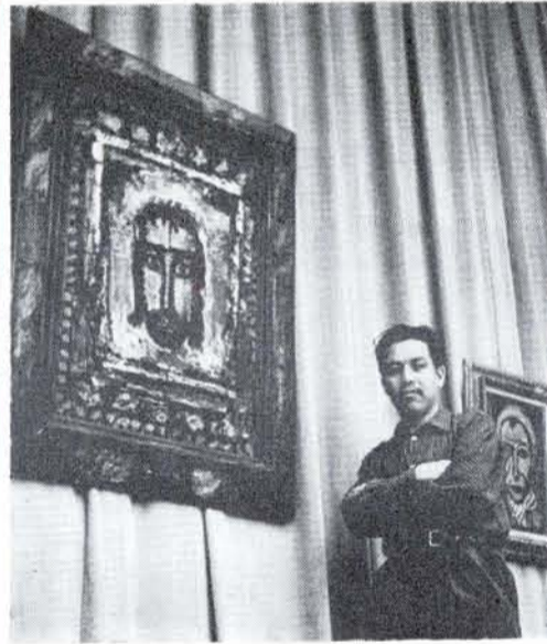
FRENTE AL Divino Rostro, de Rouault.