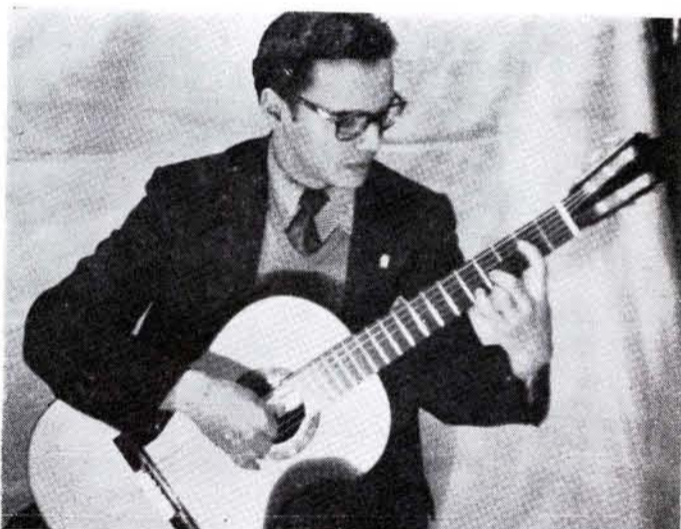
OSCAR CÁCERES, el admirable guitarrista uruguayo.