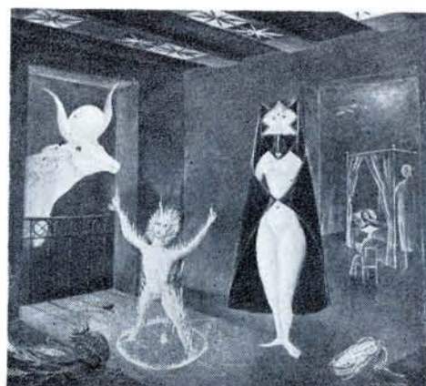
LEONORA CARRINGTON es la autora.

te folklórico nacional... Sus figuras y paisajes impresionaron muy favorablemente a los expertos y al público en general... Los SALONES DE CARMEL-ART organizaron una exposición colectiva de pintores y escultores, presentando a MANUEL FELGUEREZ, LILIA CARRILLO, RAUL GAMBOA y HENRY LAGAN, cuyas obras se apartan mucho del realismo que vuelve de nuevo a dominar en los medios artísticos internacionales y mexicanos... El escultor JORGE DURON, abstraccionista aunque no del todo, expuso un conjunto de piezas en que se destacaba notablemente una talla titulada "El Cuervo"... Su presentación tuvo lugar en los salones de la GALERÍA PROTEO... JACOB HELLER llevó sus obras a la GALERÍA DE LA SOCIEDAD DE ARQUITECTOS... En las GALERIAS IN-