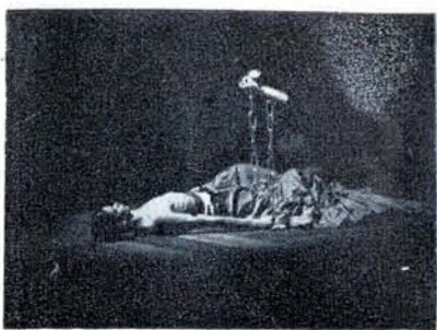
ZAPATA DE GUILLERMO ARRIAGA