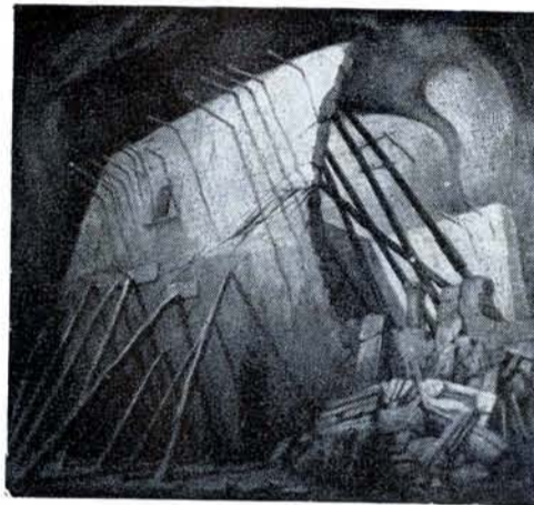
LA CASA Apuntalada, de G. Camarena.

La exposición de mayor trascendencia verificada en la ciudad de México en el transcurso de marzo último, fue la del III Salón de Invierno del SALÓN DE LA PLÁSTICA MEXICANA, dependencia del INBA... La crítica periodística protestó contra la denominación "de Invierno" alegando la proximidad de la Primavera; pero, por lo demás, reconoció el aspecto positivo del suceso (información amplia en páginas interiores)... MANUEL TARRAGONA expuso en sala individual una colección de sus más recientes pinturas en la Galería EL ECO... su obra es decorativa, modernista, y deja transluir cierta influencia japonesa... En la GALERÍA DEL MUSEO NACIONAL DE ARTES PLÁSTICAS fueron puestos en exhibición los grabados de MARIA HISZPANSKA... Inés Amor (GALERÍA DE ARTE MEXICANO) ofreció una estupenda serie de pinturas de LEONORA CARRINGTON, considerada por los críticos sorprendente y extraordinaria; obra que revela inquietud sin límites y ejecución incomparable... La GALERÍA DE ARTE MODERNO presentó en su gran salón de pintura, la obra retratista y de paisaje de JOSE GARCIA NAREZO... A este artista se le conocía exclusivamente por las composiciones en que hacía aparecer casi siempre objetos del ar-