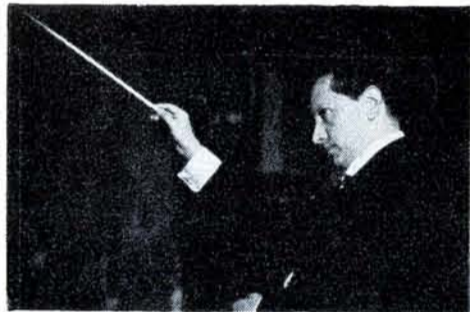
LUIS HERRERA DE LA FUENTE